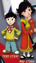
TERY STERY MAY STERY