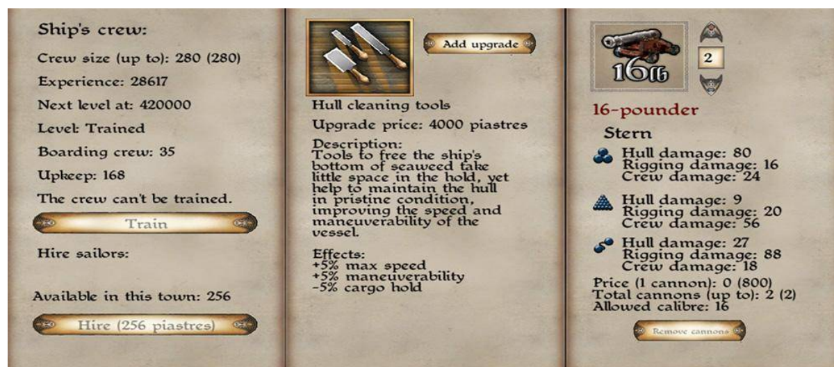
Сводный пример режимов управления кораблем. Слева направо: режим управления командой, режим управления модификациями, режим управления орудиями.

Что касается улучшения команды, оно производится однократно после набора: рекрутированных в матросы можно улучшить с новичков до опытных. В случае существенного донабора команды, обучение будет необходимо повторить.